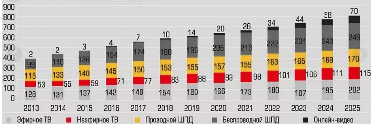
Объем сегментов телеком-рынка, млрд рублей